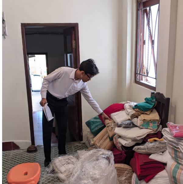
Gambar 1. Pengecekan Linen Laundry

Temuan tersebut diperkuat oleh hasil stock opname awal pada bulan pertama yang menunjukkan adanya selisih sebanyak 71 unit linen atau sebesar 3,38% dari total linen yang diproses. Selisih ini mengindikasikan bahwa sistem pengendalian inventory belum berjalan secara optimal dan berpotensi menimbulkan berbagai konsekuensi operasional, seperti keterlambatan penyediaan linen, meningkatnya biaya pengadaan, serta kesulitan dalam perencanaan kebutuhan persediaan. Menurut Heizer et al., ketidakakuratan pencatatan inventory dapat meningkatkan risiko kehilangan aset, pemborosan biaya operasional, dan menurunkan kualitas pengambilan keputusan manajerial (Heizer et al., 2019).