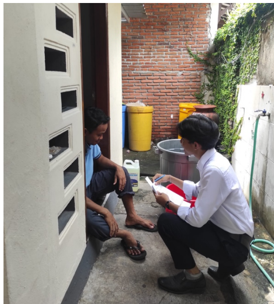
Gambar 3. Pengecekan Linen Laundry

Kegiatan pendampingan diawali dengan sosialisasi kepada seluruh staf laundry dan housekeeping mengenai prosedur baru yang telah disusun. Materi yang disampaikan mencakup Standar Operasional Prosedur (SOP) pencatatan linen keluar-masuk, penggunaan kartu stok harian dan rekapitulasi bulanan, mekanisme serah-terima linen, serta tata cara pelabelan inventaris. Selanjutnya, staf diberikan pelatihan dan praktik langsung agar memiliki pemahaman yang sama dalam menerapkan sistem yang baru. Pendekatan ini sejalan dengan konsep on-the-job training yang dinilai efektif dalam meningkatkan keterampilan operasional, pemahaman prosedur kerja, serta kemampuan pengelolaan persediaan di lingkungan kerja [10].